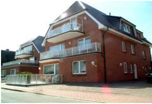
Eine weitere Hausansicht vom BERNstein "Supreme".