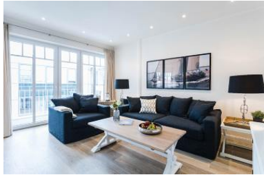
Die Unterkunft befindet sich im 2.OG.

Glück hat ein Zuhause: Die STRANDVILLA, ein wunderschöner Neubau, 73 qm Hideaway in perfekter Lage, direkt in der Fußgängerzone (Alleestraße) von Büsum. Nur eine Gehminute vom Hauptstrand, Museumshafen und Sauna- und Erlebnisbad Piratenmeer entfernt.