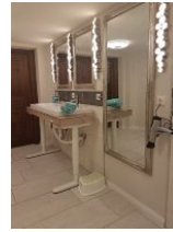
Der verstellbare Waschtisch