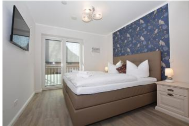
Die Unterkunft befindet sich im 1.OG.

Licht & Raum für Urlaub in der Heider Straße Büsum: Was macht man, wenn man die Chance hat ein Feriendomizil von Anfang an perfekt zu gestalten?