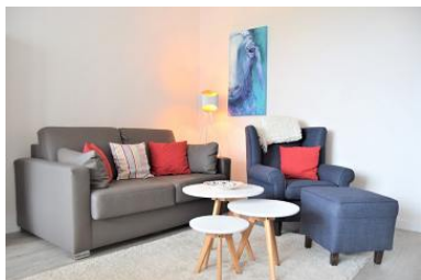
Die Unterkunft befindet sich im 2.OG.

Die Ferienwohnung liegt im Herzen von Büsum. Durch die ideale Lage erreichen Sie das Zentrum, sowie die Familienlagune und auch Einkaufsmöglichkeiten in kurzer Zeit. Auf 50 m 2 ist im Frühjahr 2017 eine kleine Wohlfühloase für Sie entstanden, in der bis zu 4 Personen entspannen können. Egal ob es der Jahresurlaub, ein Kurztrip oder ein spontanes Wochenende sein darf. Auch an die Kleinsten ist gedacht. Ein Reisebett (mit Matratze) steht kostenlos zur Verfügung. Hochstuhl, Kinderbesteck - Geschirr, Spielzeug, Bücher u.v.a. wartet auf die Kleinen. Für Krimifans steht eine "Minibibliothek" zur Verfügung. Mit der Morgensonne das Frühstück auf dem Balkon genießen und am Abend nach einem erlebnisreichen Tag, vielleicht mit einem Glas Wein den Tag ausklingen lassen. Wenn Sie gerne kochen, wird dies in der komplett ausgestatteten Küche zum Kinderspiel. Von 4-Plattenherd über Backofen bis zur Kaffeemaschine ist alles vorhanden, um im Essbereich des Wohnzimmers ein zauberhaftes Frühstück, Mittag- oder Abendessen zu servieren. Wir wünschen Ihnen unvergessliche Tage in unserer Wohnung. Zwischenzeitlich kann es zu Bauarbeiten im Haus kommen!