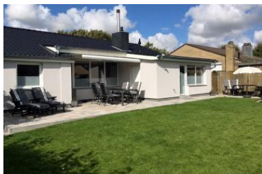
Die Unterkunft verteilt sich über EG und 1.OG.

Genießen Sie Ihren Urlaub im beliebten Erlengrund. Den Strand erreichen Sie in etwa 5 Gehminuten. Dieses wunderschöne Ferienhaus ist im ersten Halbjahr 2017 kernsaniert worden. Das Haus besteht aus zwei exklusiven Doppelhaushälften, die auch separate gebucht werden können (ID 416 + 417). Dadurch stehen Ihnen zwei komplett ausgestattete Küchen, zwei Vollbäder und ein Gäste WC, sowie vier Schlafzimmer und ein kombiniertes Wohn-Schlafzimmer zur Verfügung. Die Schlafzimmer sind wie folgt aufgeteilt: eines mit Doppelbett (Einzelmatratzen), ein weiteres mit 2 Einzelbetten, eines mit Doppelbett (Einzelmatratzen), das Sie über eine Raumpartreppe im 1. OG erreichen mit Deichblick (Höhe der Decke max. 1,20m, ) eines mit zwei Einzelbetten und ein weiteres mit Doppelbett mit Einzelmatratzen im kombinierten Wohn-Schlafbereich. In einem der Wohnzimmer wurde extra für Sie ein Holzkamin angeschlossen. Verbringen Sie schöne Stunden auf den sonnigen Terrassen (eine davon mit Markise) oder im gepflegten Garten. Am Haus befindet sich ein Parkplatz im Carport und öffentliche Parkplätze in ca. 20 m Entfernung (nach Verfügbarkeit). Im Garten steht ein Gas Grill zur Verfügung.