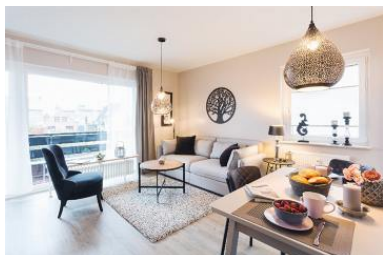
Die Unterkunft befindet sich im 1.OG.

Die geschmackvolle Wohnung wurde Ende 2017 für Sie kernsaniert. Es wurden hochwertige Einbauten ausgewählt. In der kleinen aber stillvollen Küche finden Sie ein Ceranfeld mit 2 Platten, einen Geschirrspüler und einen Kühlschrank mit Gefrierfach. Das geräumige Wohnzimmer lädt zum Verweilen ein. Genießen Sie ein Glas Wein auf dem großen überdachten Südwest Balkon. Die Wohnung liegt in ruhiger Strand- und Deichnähe. Die Familienlagune erreichen Sie nach nur wenigen Gehminuten. Ein Supermarkt sowie Bäcker sind ebenfalls bequem zu Fuß erreichbar. Genießen Sie die schönste Zeit des Jahres in unserer liebevoll eingerichteten Wohnung auf Zeit.