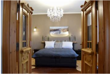
Die Unterkunft befindet sich im EG.