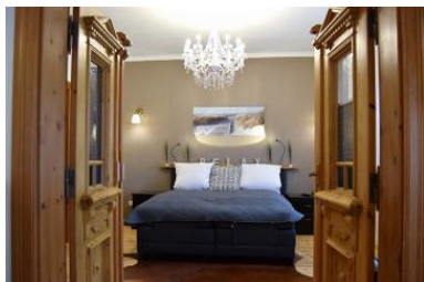
Die Unterkunft befindet sich im EG.