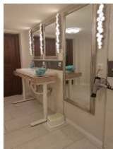
Der verstellbare Waschtisch