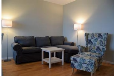
Die Unterkunft befindet sich im 2.OG.

Unsere gemütliche 3 Raum- Fewo im Hochhaus von Büsum bietet Ihnen einen wundervollen Blick auf die Nordsee! Die Wohnung wurde Ende 2017 geschmackvoll renoviert und komplett neu möbliert. Entspannen Sie auf dem großzügigen Balkon und genießen Sie den Blick auf die Nordsee. Die Morgensonne verzaubert Sie bei einem tollem Frühstück im Wohnzimmer oder im Sommer auf dem Balkon. Das Zentrum mit den Einkaufsmöglichkeiten sowie den idyllischen Büsumer Hafen erreichen Sie ebenfalls in kurzer Zeit bequem zu Fuß. Ein Pkw-Stellplatz befindet sich direkt am Haus. Wir wünschen unseren Gästen eine schöne Zeit und einen erholsamen Urlaub in Büsum.