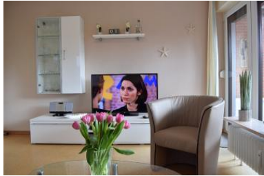
Die Unterkunft befindet sich im EG.

Verbringen Sie Ihren Urlaub in unserer geschmackvoll eingerichteten 3-Raum-Wohnung im EG für maximal 4 Personen. Die Wohnung verfügt über 2 Schlafzimmer, einem gemütlichen Wohn- und Essbereich, einer neuen Kochnische und einem neuen Duschbad. Der Wohnbereich verfügt über eine bequeme Sofagarnitur, einem großzügigen Essbereich sowie einen Flachbild-TV. Die Wohnung ist mit Liebe zum Detail eingerichtet und renoviert worden. Die sonnige Terrasse hinter dem Haus lädt zum verweilen ein. Terrassenmöbel, Strandkorb und Sonnenmarkise sind selbstverständlich vorhanden. Den Strand und den Kurpark erreichen Sie bequem zu Fuß in wenigen Gehminuten. Wir wünschen Ihnen einen angenehmen und erlebnisreichen Urlaub.