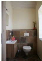
Das Gäste-WC direkt neben dem Eingang.