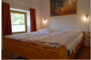
Zweites Schlafzimmer mit großem Schrank