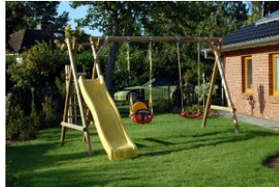
Hier sehen Sie den kleinen Hauseigenen Spielplatz