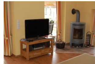
Blick auf Fernsehecke mit DVD-Player, Musikanlage und Kamin