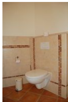
Das WC im großen Badezimmer, gut versteckt zwischen Tür und Sauna