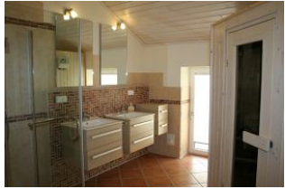
Das Bad mit zwei Waschtischen, geräumiger Dusche, Sauna und Aussenzugang.