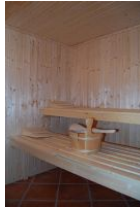
Und hier das Highlight ( die Sauna) für kühle Tage