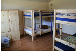
Das Kinderzimmer: zwei Etagenbetten, Schrank und zwei Ablageflächen