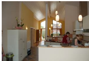
Blick durchs ganze Haus: vom Eingang bis zur Terrassentür