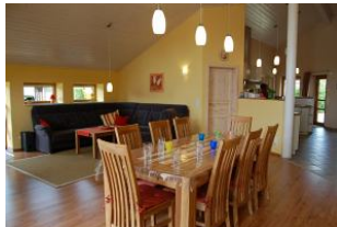
Blick auf Ess- und Wohnbereich, im Hintergrund die offene Küche