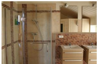
Das Bad aus einem anderen Blickwinkel: die großzügige Dusche